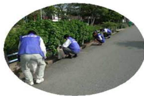
ボランティア委員会

6月は営業部、設計積算部の方々の参加協力で会社周辺清掃活動を行いました。ありがとうございました。