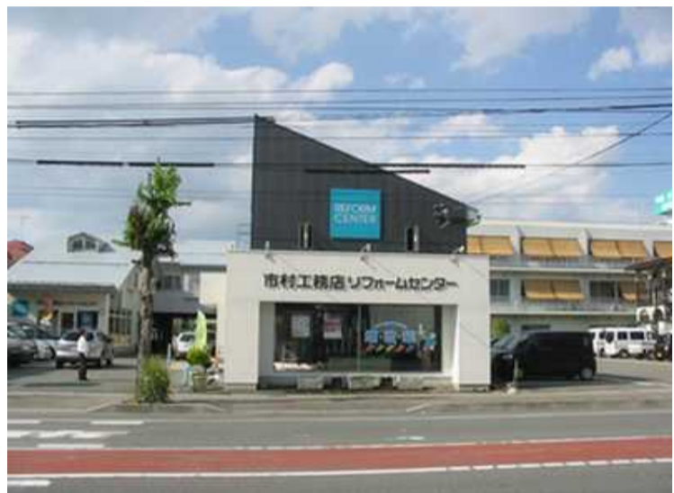
ただいま改装中のリフォームセンター