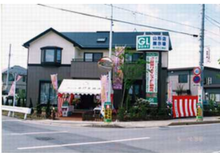
10年前 オープン当初の展示場

7月からは心機一転・・・新たな気持ちで頑張りたいと思います。我々住宅事業部も、この『ヤマボウシ』に負けないように、大きくそして高く理想を持って頑張っていきますので、今後共よろしくをお願いします。